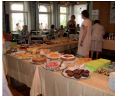
Müffele und Süffele