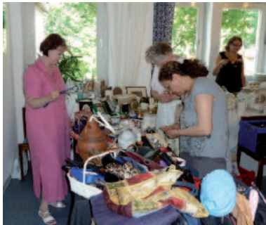
Trödel und Bücher