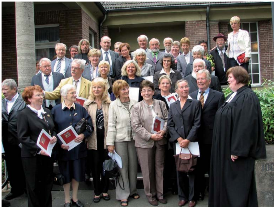
Das Konfirmanden Foto 2009

Den bewegenden Festgottesdienst, in dem alles harmonisch auf das Konfirmationsjubiläum abgestimmt war, hielt Frau Pfarrerin Crohn. Als Predigttext hatte sie einen Auszug aus Epheser 1 gewählt. Vor der Abendmahlsfeier wurden alle Konfirmanden an ihren Konfirmationspruch erinnert und gesegnet. Das Abendmahl wurde auf zwei Kreise aufgeteilt, sodass jeweils ein Jahrgang Konfirmanden zusammen mit anderen Gottesdienstbesuchern das Abendmahl feiern konnte. Zum Abschluss des Gottesdienstes wurde ein eigens für diese Feier gedichtetes Lied gesungen.