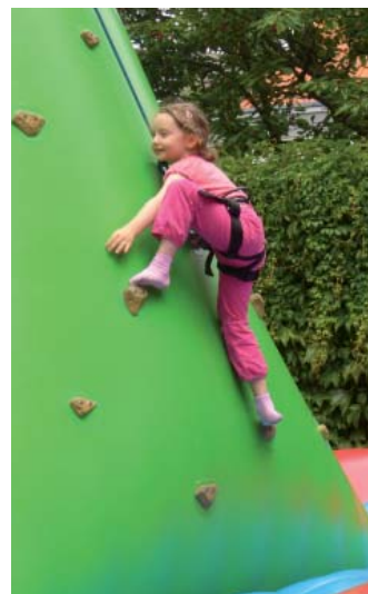
Jugend trainiert für Olympia