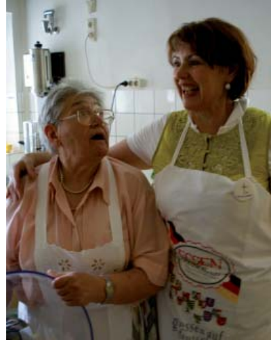
Zwei große Küchenfeen