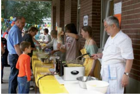
Non-Stop Pommes und Salate