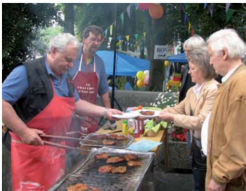
Und sie grillen und grillen und grillen ...