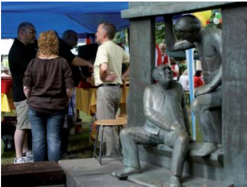
„Das Gespräch“ - in Bronze und live