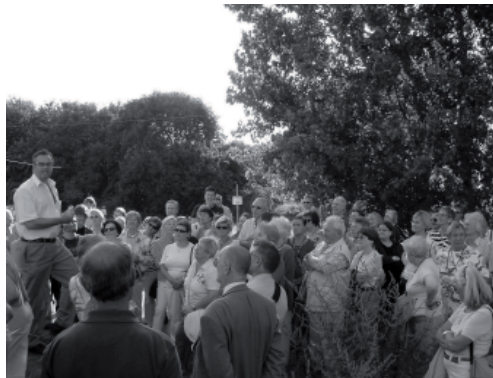
Die 5. Ökum. Stadttealführung führte uns im August 2008 zu verschiedenen „Baustellen“ im Weidener Osten

Beginnend am Marktplatz machen wir uns auf einen vorbereiteten Weg durch Weiden. Inhaltlich lassen wir uns dabei leiten vom Thema des diesjährigen ökumenischen Schöpfungsmonats September.