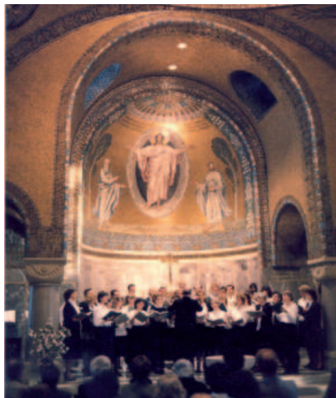
Konzert in der Erlöserkirche in Gerolstein

Vor fünfzig Jahren, im April 1961, entwickelte sich aus dem „ Evangelischen Kirchenchor Weiden “, der auch schon eine fünfzigjährige Geschichte hatte, unter der